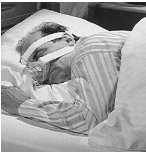
Dit is een plaatje van een neusmasker bij de behandeling met nasale CPAP.

De beste methode is 'nasale CPAP', via de neus toegediende Continue Positieve luchtweg druk (= Airway Pressure). Hierbij wordt een neusmasker gedragen dat met een slang verbonden is aan een apparaat. Dit apparaat pompt voortdurend lucht in de neus en keel tijdens het in- en uitademen. Hierdoor ontstaat een overdruk, zodat de wanden van de keelholte niet samen kunnen vallen. Er treden dan veel minder ademstilstanden op en ook het snurken is meestal verdwenen.